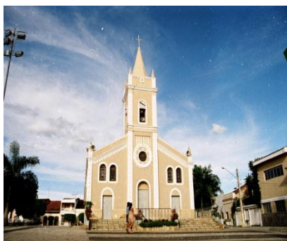
Figura 2 – Catedral de Salgueiro