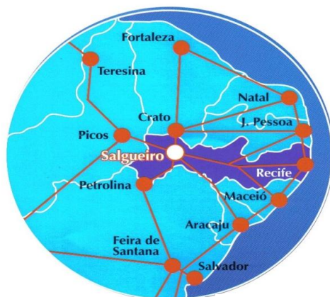
Figura 1 – Localização do Município de Salgueiro

No cruzamento das BR's 232 e 116 que também dá acesso as BRs 101 e 316, o município está no coração do Nordeste, sedia a microrregião de Salgueiro e a Região de desenvolvimento do Sertão Central. Com uma localização estratégica do ponto de vista logístico, Salgueiro é o centro geodésico do Nordeste, tem fácil acesso e é equidistante das capitais nordestinas em média 596 km, exceto São Luiz. É rota da ferrovia transnordestina, passando a partir da conclusão da ferrovia a ter ligação ferroviária com os dois maiores portos do Nordeste SUAPE (Pernambuco) e PECÉM (Ceará). No extremo norte do Estado, Salgueiro está na divisa com o Estado do Ceará, a 60 km da Bahia e menos de 200 km do Estado do Piauí.