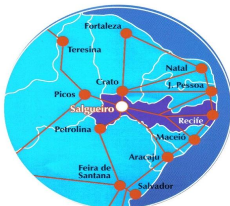
Figura 1 – Localização do Município de Salgueiro

No cruzamento das BR's 232 e 116 que também dá acesso as BRs 101 e 316, o município está no coração do Nordeste, sedia a microrregião de Salgueiro e a Região de desenvolvimento do Sertão Central. Com uma localização estratégica do ponto de vista logístico, Salgueiro é o centro geodésico do Nordeste, tem fácil acesso e é equidistante das capitais nordestinas em média 596 km, exceto São Luiz. É rota da ferrovia transnordestina, passando a partir da conclusão da ferrovia a ter ligação ferroviária com os dois maiores portos do Nordeste SUAPE (Pernambuco) e PECÉM (Ceará). No extremo norte do Estado, Salgueiro está na divisa com o Estado do Ceará, a 60 km da Bahia e menos de 200 km do Estado do Piauí.