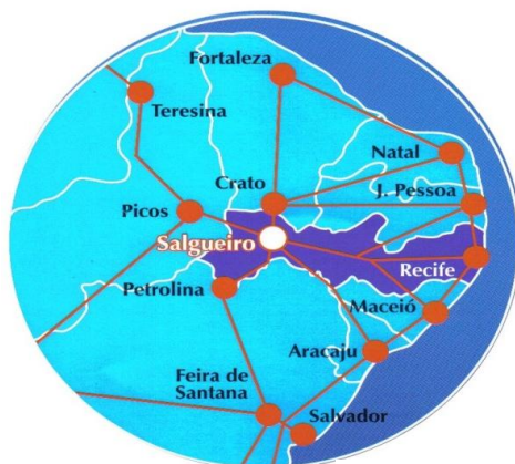
Figura 1 – Localização do Município de Salgueiro

No cruzamento das BR's 232 e 116 que também dá acesso as BRs 101 e 316, o município está no coração do Nordeste, sedia a microrregião de Salgueiro e a Região de desenvolvimento do Sertão Central. Com uma localização estratégica do ponto de vista logístico, Salgueiro é o centro geodésico do Nordeste, tem fácil acesso e é equidistante das capitais nordestinas em média 596 km, exceto São Luiz. É rota da ferrovia transnordestina, passando a partir da conclusão da ferrovia a ter ligação ferroviária com os dois maiores portos do Nordeste SUAPE (Pernambuco) e PECÉM (Ceará). No extremo norte do Estado, Salgueiro está na divisa com o Estado do Ceará, a 60 km da Bahia e menos de 200 km do Estado do Piauí.