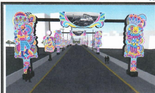
Foto 1: Imagem ilustrativa para servir como referência para o ITEM 1