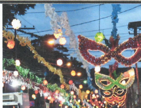
Foto 4: Imagem ilustrativa para servir como referência para o ITEM 4

Rua Belarmino Angelo, nº 600, Bairro Nossa Senhora Aparecida CEP: 56000-000