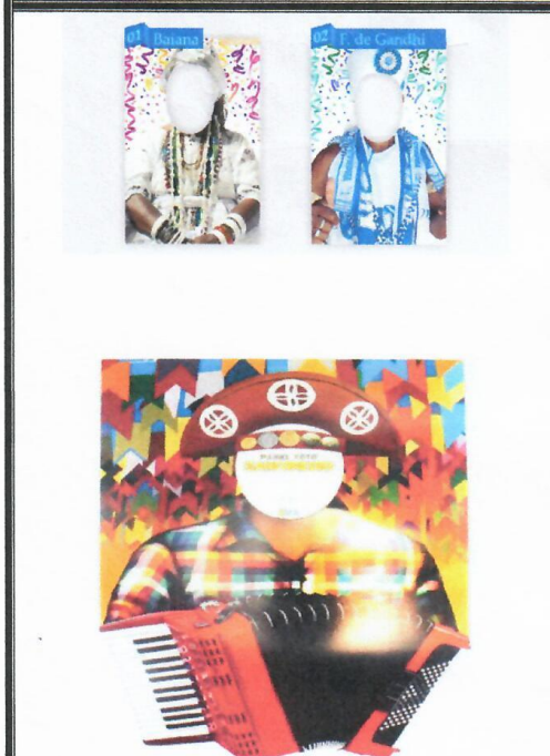
Foto 3: Imagem ilustrativa para servir como referência para o ITEM 3 (COM TEMA CARNAVALESCO)