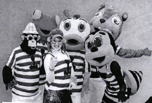
A BARCA MALUCA POLO BOMBA