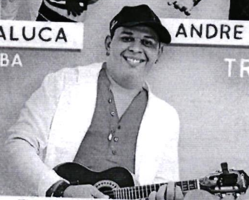
PAGODE DO W POLO BOMBA